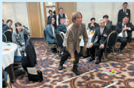
▲初の試み“ゲーム大会”大いに盛り上がりました

青年部会では、1月24日に『新春・部会員の集い』を、第1部が「労務セミナー」・第2部が「新年会」というスタイルで開催されました。第1部の労務セミナーは、“ハラスメント予防”がテーマであり、法律面から見たハラスメント予防を弁護士から、実務面から見たハラスメント予防を社会保険労務士から解説していただきました。「ハラスメントをする人は、自分の行為がハラスメントで