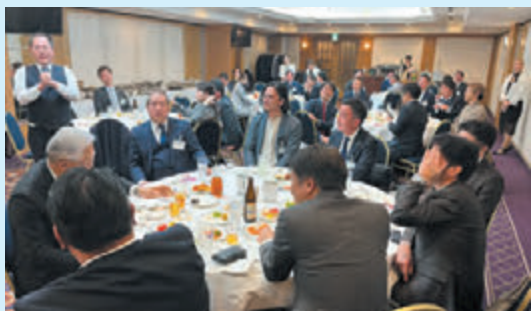
▲気心の知れた仲間が集いました