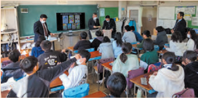
▲講師も授業のサポートも加住地区役員が担当しました