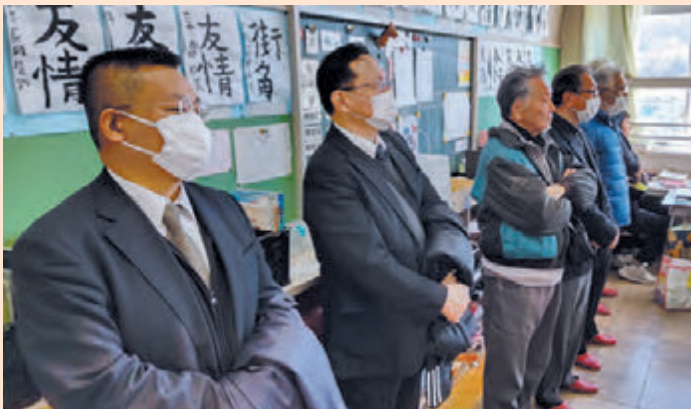
▲地元小学校での租税教室を見学する地区役員の方々