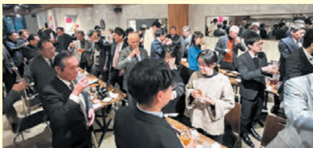
▲地区の枠を超えた幅広い交流の場となりました