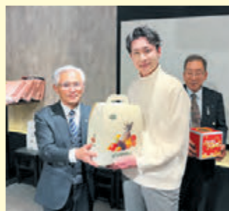
▲お楽しみ抽選会で景品を手に記念撮影