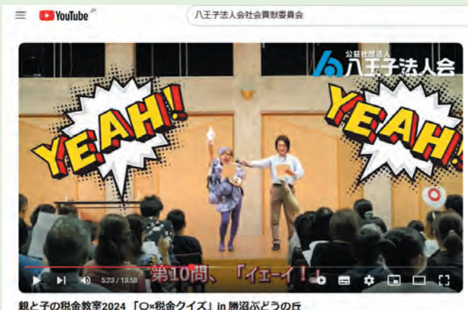
親と子の税金教室2024 「〇×税金クイズ」 in 勝沼ぶどうの丘