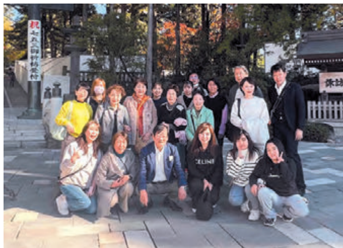
▲「諏訪大社下社秋宮」で記念撮影

恩方地区では、11月9日に、諏訪方面まで足を延ばしました。土曜日の開催でもあり、道路は渋滞が続きましたが、天候に恵まれ、富士山も綺麗に観え、快適なバスの旅となりました。