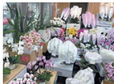
多種多様なお花を取り扱っています

〒192-0071 八王子市八日町5-14 電話：042-634-8711 https://www.nihonflower.com/