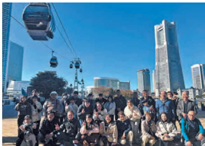
▲みなとみらいの景観をバックに記念撮影

西部地区では、11月24日に、横浜中華街、みなとみらいを中心に巡るバスツアーを開催。最初に、新たにみなとみらいのアイコンとなった都市型ロープウェイ「エアキャビン」で、桜木町から運河パークまで移動しました。参加者全員初めての搭乗で、期待通りの楽しい体験となりました。お昼は「横浜中華街」の散策と、中華料理を楽しみました。更にバスで「赤レンガ倉庫」に移動後、お土産などの買い物をし、最後は「マリンルージュ」のアフタヌーンクルーズで、横浜港を一周。ベイブリッジの真下から眺める景色は壮観でした。