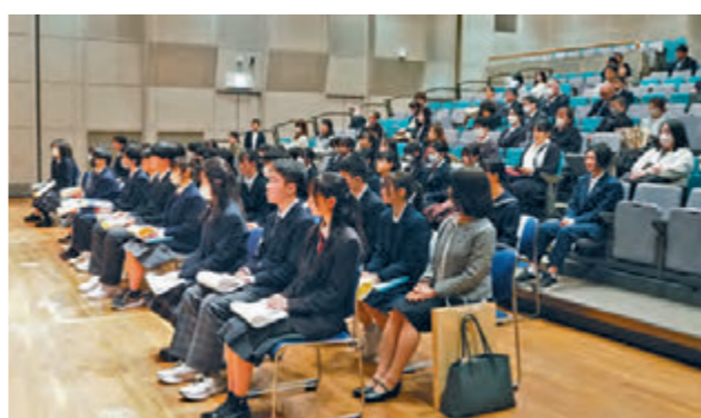
保護者や学校関係者が見守る中、表彰式は開催されました

私は、みんなが互いに支え合い、よりよい社会を作っていくべきだと思う。そのために、税金は欠かせない。私も大人になって、皆のために想って税を納められる人になりたい。