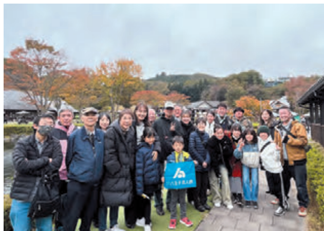
▲見どころたくさん「道の駅・川場田園プラザ」で記念撮影

中央地区では、11月10日に、社員家族交流事業の一環として、群馬方面へのバスツアーを実施しました。「道の駅・川場田園プラザ」から始まり、「酒造見学」「リンゴ狩り」と、買物や体験を満喫しました。「道の駅・川場田園プラザ」は、「全国道の駅グランプリ2年連続受賞」を獲得しており、リピート率が非常に高い道の駅として有名です。見どころも多く、単なる「道の駅」でないということが実感できました。酒造見学、リンゴ狩りも大いに楽しめ、満足度の高い一日を過ごすことができた事業となりました。