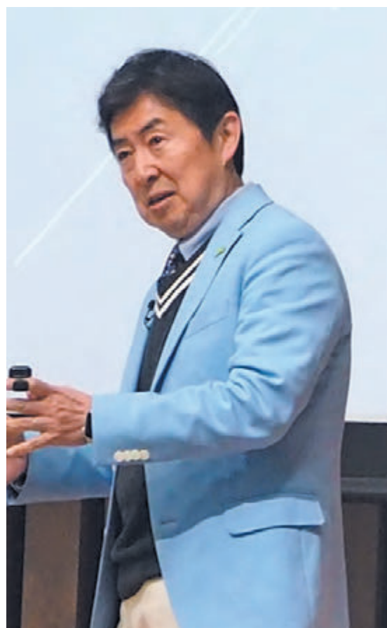
自身の闘病経験などを熱く語った笠井信輔氏