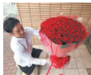
心を込めて「豪華な赤薔薇の花束」も綺麗にアレンジできます