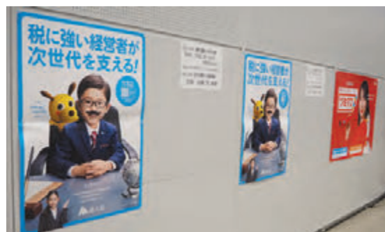
会場内にポスターを掲出し法人会をPR