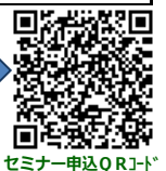
セミナー申込QRコード

※本申込書にご記入いただいた個人情報等につきましては、この事業の開催に係わる申込者の確認・名簿の作成・運営に関する連絡及び報告、各種セミナー等開催連絡の目的にのみ使用いたします。