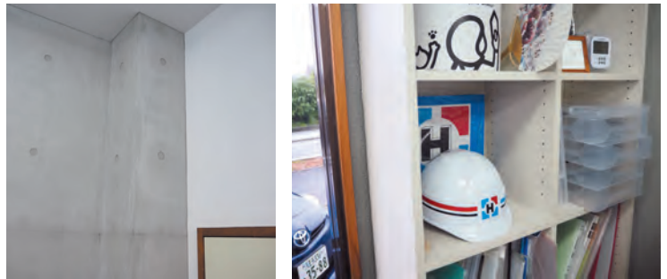
事務所内の壁は来客の目を引きます