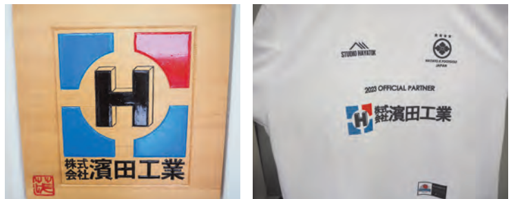
ロゴマークを入れたプレートやシャツも事務所内を飾ります