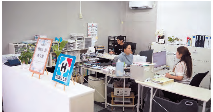
事務所内の内装もそれぞれの面で違う仕上げを取り入れています

ひとりひとりの社員を大切にする濱田社長は2026年までに社員25名、2026年1月31日までに、業界内で社員満足度ナンバーワンの明確な目標を持ち取り組んでいます。「社員の満足度を上げていくことに力を入れています。現在でも、業界内で満足度は高くなっていますが、改善点を見つけて修正していきます。反面一人当たりの生産性を高めていくことの課題にも直面しています。」採用にも注力する濱田社長は、「未来を見据えて、学生など新人の採用にも力を入れています。東南アジアが中心ですが、外国人の技能実習生も並行して採用しているところです。私もブラジル出身ですので、日本の生活への適応の大変さと、日本の良さを理解してもらい、彼らの気持ちをくみ取りながら進めています。」(濱田社長)