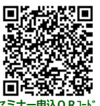
セミナー申込QRコード

※本申込書にご記入いただいた個人情報等につきましては、今回の事業開催に係る申込者の確認・名簿の作成・運営に関する連絡及び報告、各種セミナー等開催連絡の目的にのみ使用いたします。